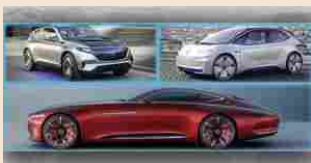
CARTECH | 06 maggio 2019 Auto elettriche, i modelli e le tecnologie rivoluzionarie

Grazie alla collaborazione con i due partner, FCA offrirà ai suoi clienti la possibilità di installare presso la propria abitazione uno specifico punto personalizzato (la cosiddetta wallbox) per l'ottimizzazione e la gestione intelligente della ricarica in base alle effettive necessità. I partner cureranno con FCA la fase preliminare, rivolta alle verifiche di fattibilità e installazione, così come la fase di gestione e manutenzione della wallbox. Il cliente sarà dunque accompagnato e assistito durante l'intero ciclo di vita del veicolo e della sua wallbox.