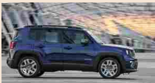
SUV | 29 novembre 2018 Jeep Renegade, ecco come sarà l'ibrida plug-in

I due partner, Enel X e ENGIE, sono entrambi leader globali nel settore energetico. La partnership con ENGIE include le controllate ENGIE Eps, società specializzata nelle soluzioni di energy storage con cui FCA collabora da oltre due anni, e EVBox, società di riferimento nella produzione di stazioni di ricarica. I partner lavoreranno con FCA in tutti i principali mercati