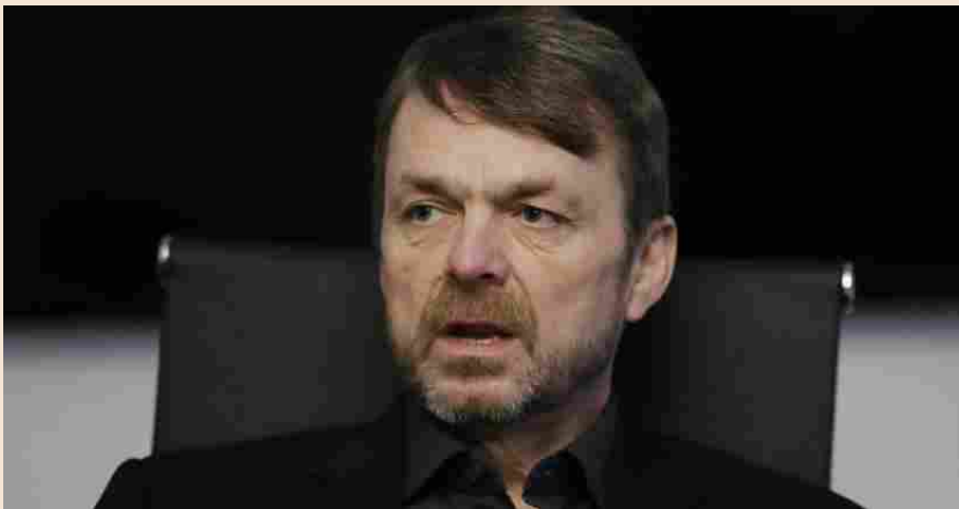
Mike Manley, Amministratore Delegato di Fiat Chrysler Automobiles